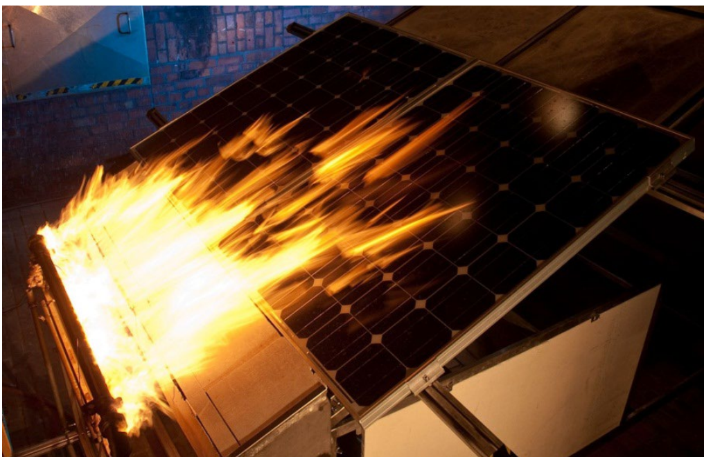
Abb. 1: Spread of Flame Test Fig. 1: Spread of Flame test

A total of three modules are required for the spread of flame test. The modules are tested both individually and side by side as a pair. In this way, a possible gap between two module or frame parts, for example, can also be evaluated in terms of fire technology. The modules are mounted on the test stand using the mounting method specified by the module manufacturer and the appropriate mounting material.